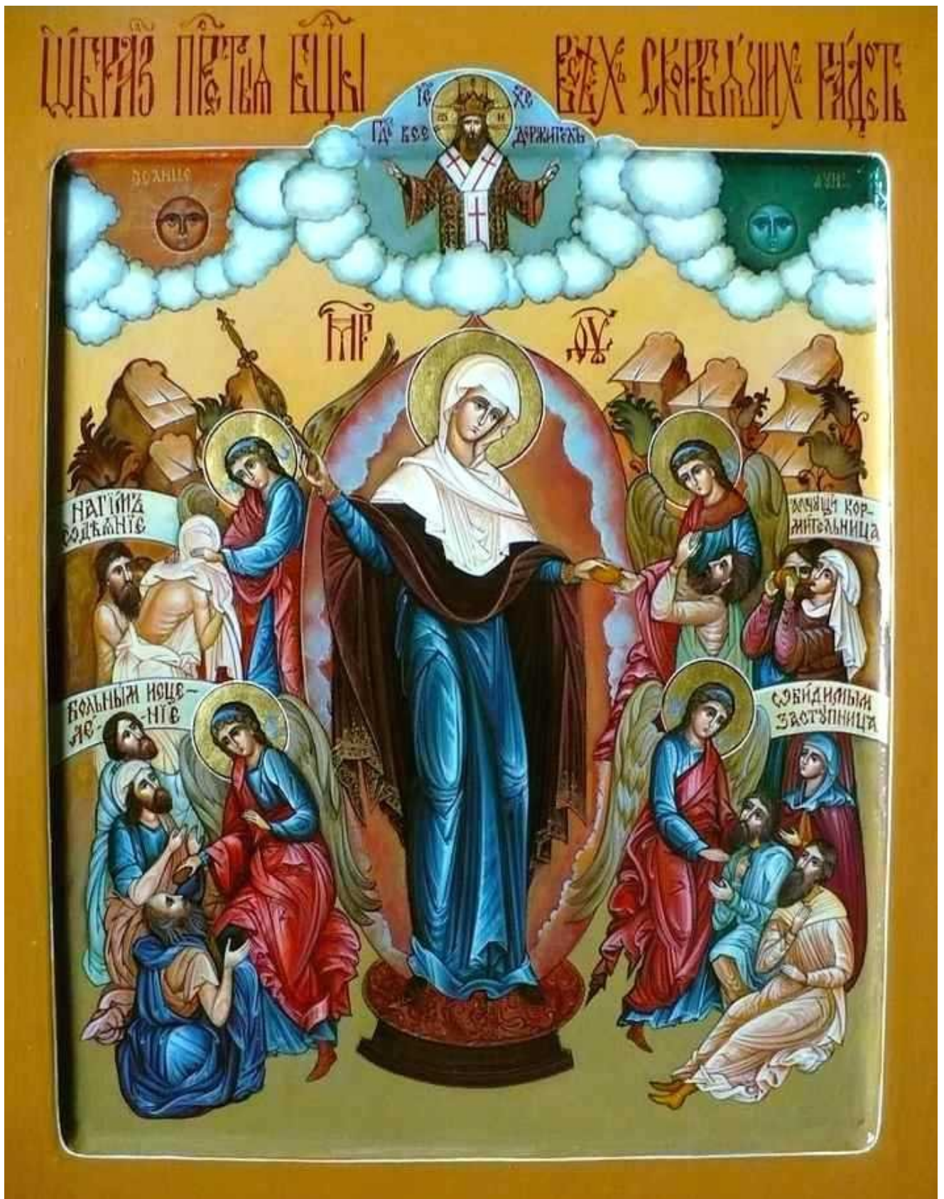
Икона Божией Матери "Всех скорбящих радость"