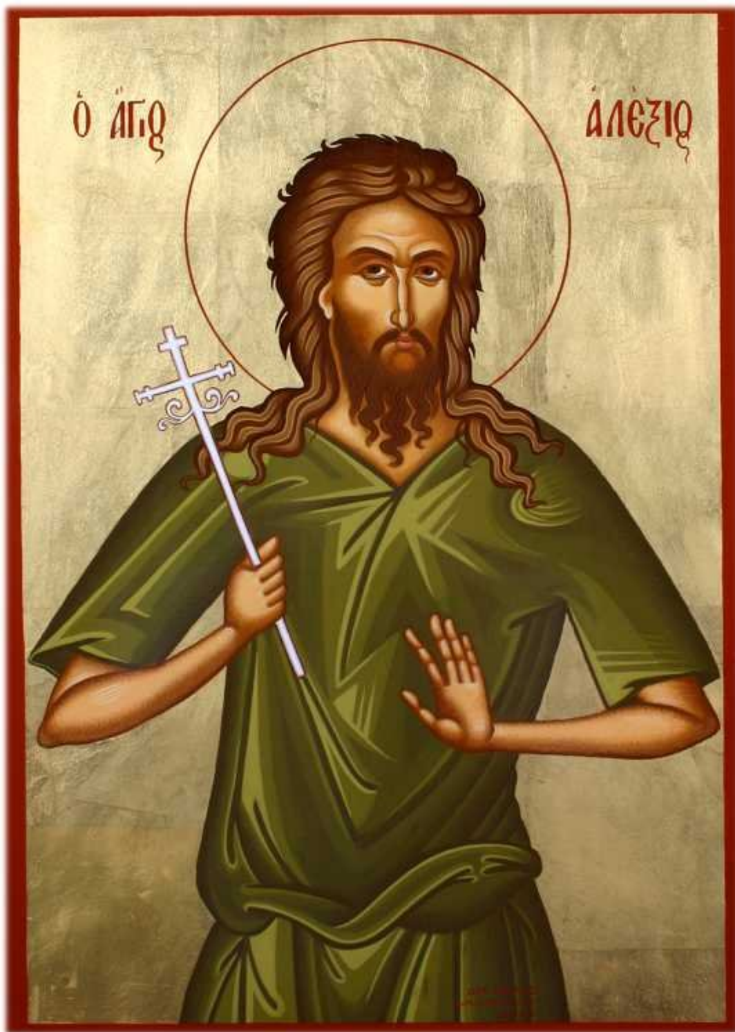
Преподобный Алексий, человек Божий