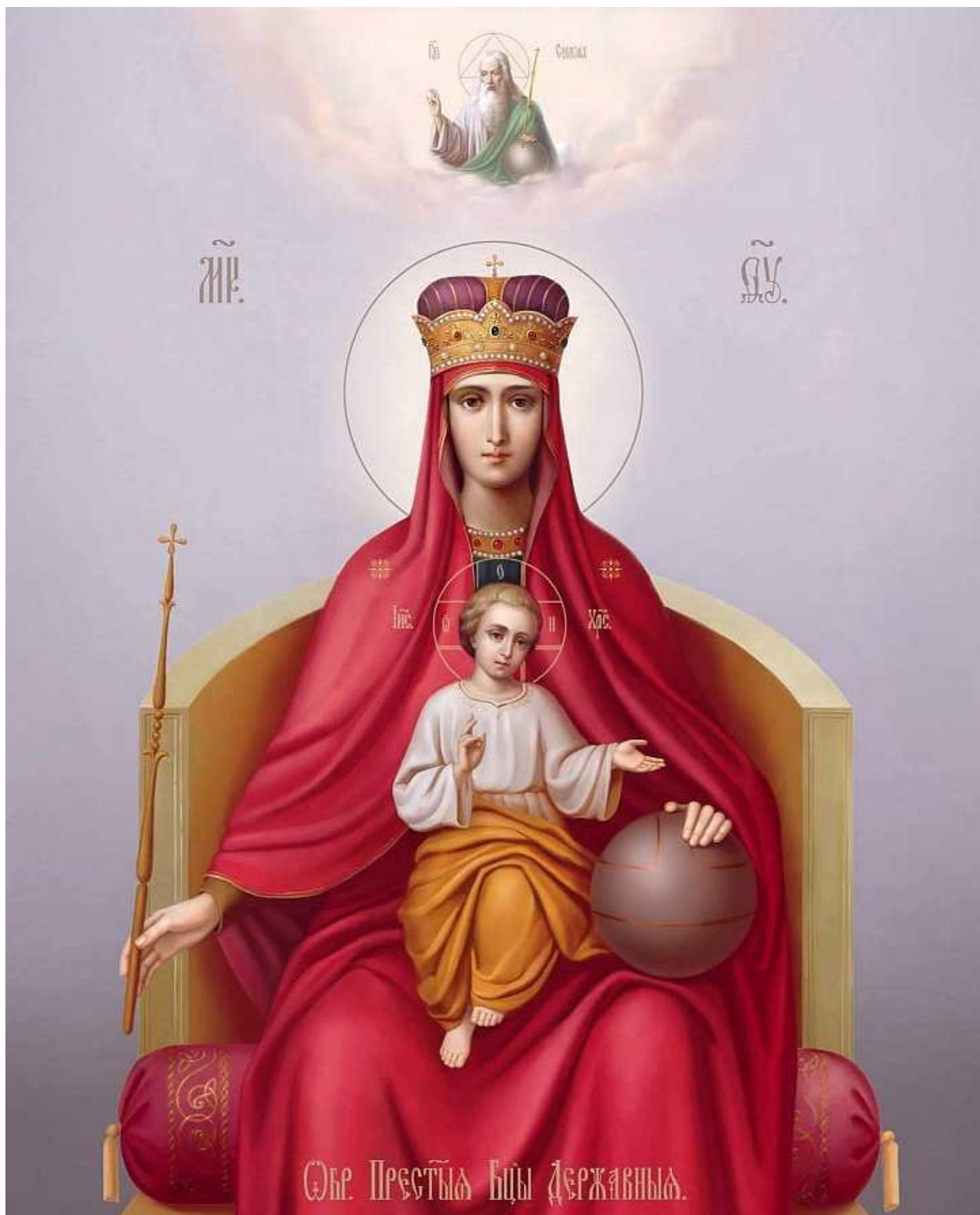
Икона Божией Матери "Державная"