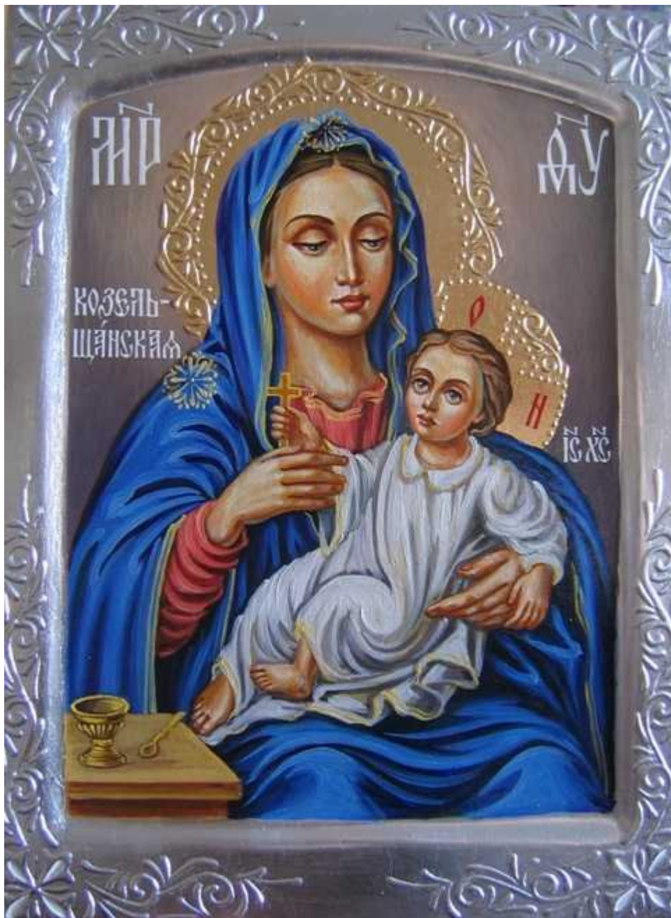
Козельщанская икона Божией Матери