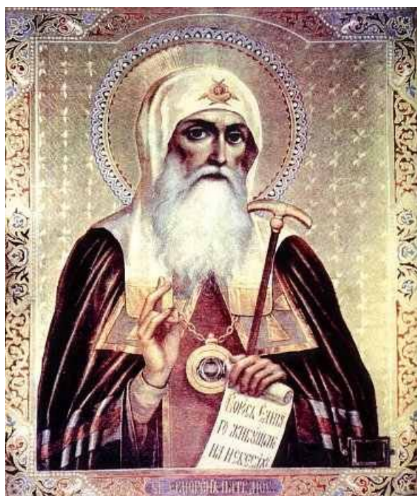
Сщмч. Ермоген, патриарх Московский и всея России, чудотворец