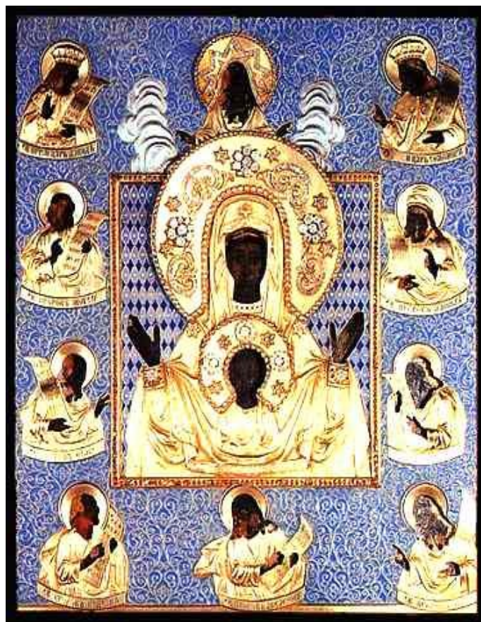
Икона Божией матери ЗНАМЕНИЕ (Курская-Коренная)

После этого икону с торжеством возвратили в пустыню и в том же году построили на месте часовни монастырь. Игумен монастыря был рыльский священник Георгий, в монашестве Евфимий. В этом же году выстроили церковь Рождества Богородицы, и под горою у самой реки