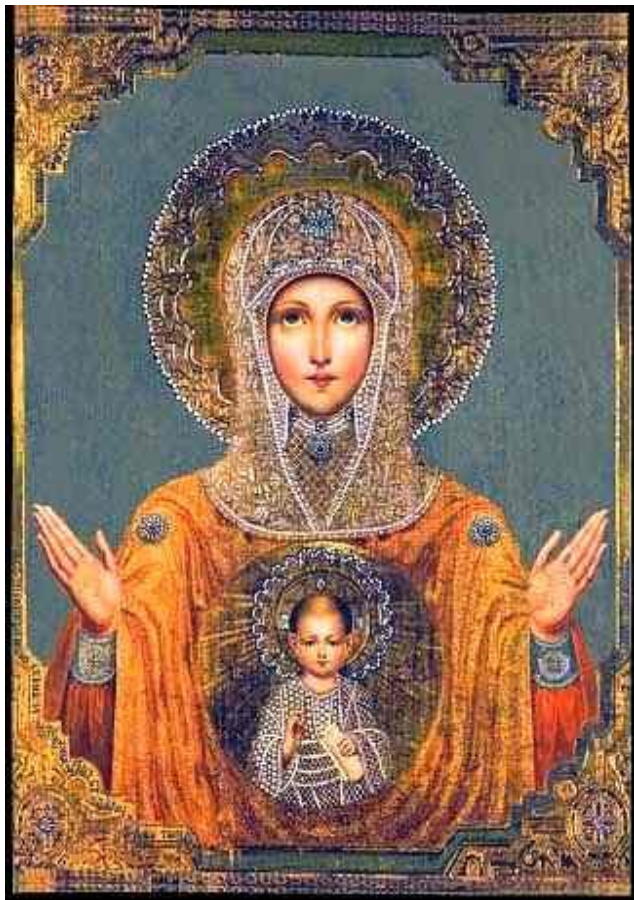
Икона Божией Матери Знамение Царскосельская