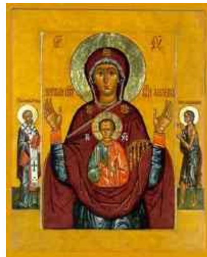
Икона Богоматери ЗНАМЕНИЕ Абалакская