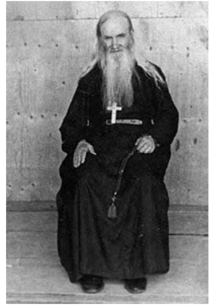
Схиархимандрит Севастиан Карагандинский

Б атюшка сохранял безупречное исполнение церковного Устава, не допуская при богослужении пропусков или сокращений. Церковные службы были для него неотъемлемым условием его внутренней жизни. Батюшка особенно благоговел перед праздниками Вознесения Господня и Святой Троицы, как завершающими дело Христа Спасителя, как венцом всех Тайн Христовых. В беседах его любимым образом был Иоанн Богослов, память которого он совершал особенно торжественно и благоговейно. Часто скорбел о недостойном почитании своей паствой этого Апостола Любви и говорил: "Вот, сегодня день памяти перенесения мощей святителя Николая, - и церковь полна народа. А вчера был праздник святого Апостола и Евангелиста Иоанна Богослова, - и церковь была полупуста. Как же вы не понимаете, кто выше и кого надо больше почитать? Какой праздник больше?" Так же он особенно чтит все семь дней памяти Предтечи и Крестителя Господня Иоанна и память святых бессребреников Космы и Дамиана (1/14 июля), как покровителей той местности, где он родился.