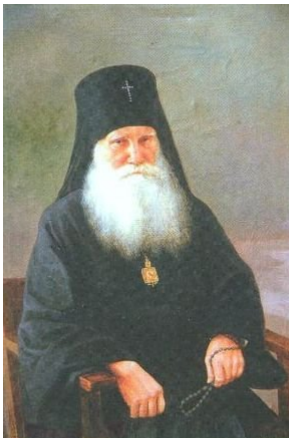
Священноисповедник Николай, митрополит Алма-Атинский и Казахстанский

Только что из уст воспитанников нашей церковно-приходской школы мы с вами слышали лишь о нескольких эпизодах той многотрудной святительской жизни, которую совершил священноисповедник Николай, митрополит Алма-Атинский и Казахстанский. Рано или поздно, в старости или в юных годах Господь всех нас зовет к Себе. И этот Божественный призыв позволяет каждому в этой суетной жизни немножечко приостановить свой бег, приостановить для того, чтобы задуматься над смыслом своей жизни, задуматься над тем, что все мы, хотя и живем сейчас на земле, но являемся детьми Неба. Когда человек, услышав этот Божественный призыв, несмотря на то, что жизнь со всеми ее прелестями старается завладеть всем его существом, задумывается над смыслом своей жизни, задумывается над тем, что он совершает, и, осознав свой личный грех, с покаянием обращается к Богу, - это на нашем русском языке называется "призыванием". Но мы из опыта нашей личной жизни знаем, что недостаточно только услышать этот призыв Божий, и недостаточно, может быть, сделать всего несколько шагов по направлению к Богу. Необходимо, чтобы вся жизнь человека была ответом на этот Божественный призыв.