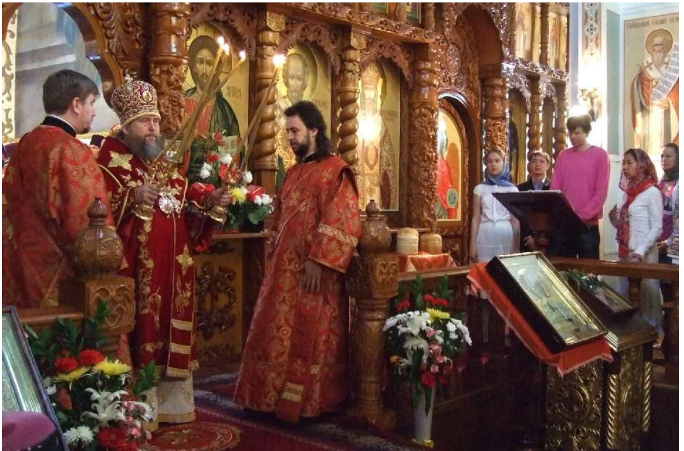
Настоятель Никольского собора раздает Благодатный огонь, привезенный из Иерусалима 15 апреля