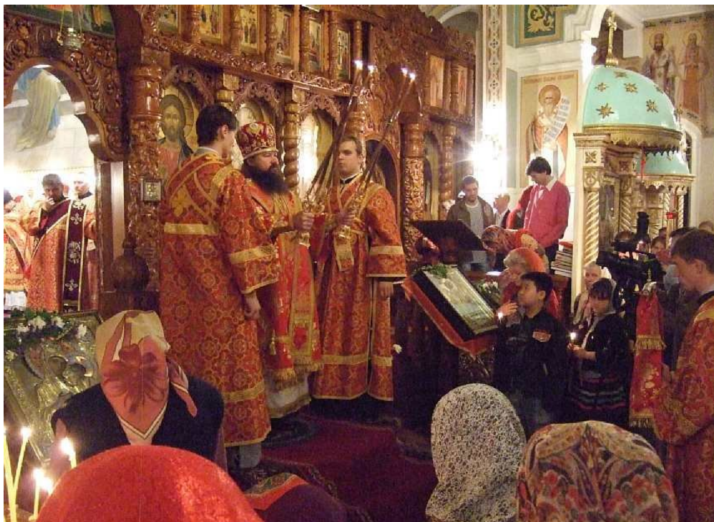
Пасхальную службу ведет епископ Дубновский Нектарий (Фролов)