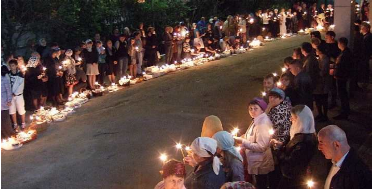
БОЖЕСТВЕННУЮ ЛИТУРГИЮ ВЕЛИКОЙ СУББОТЫ ВЕДЕТ ВЛАДЫКА НЕКТАРИЙ, ЕПИСКОП ДУБНОВСКИЙ