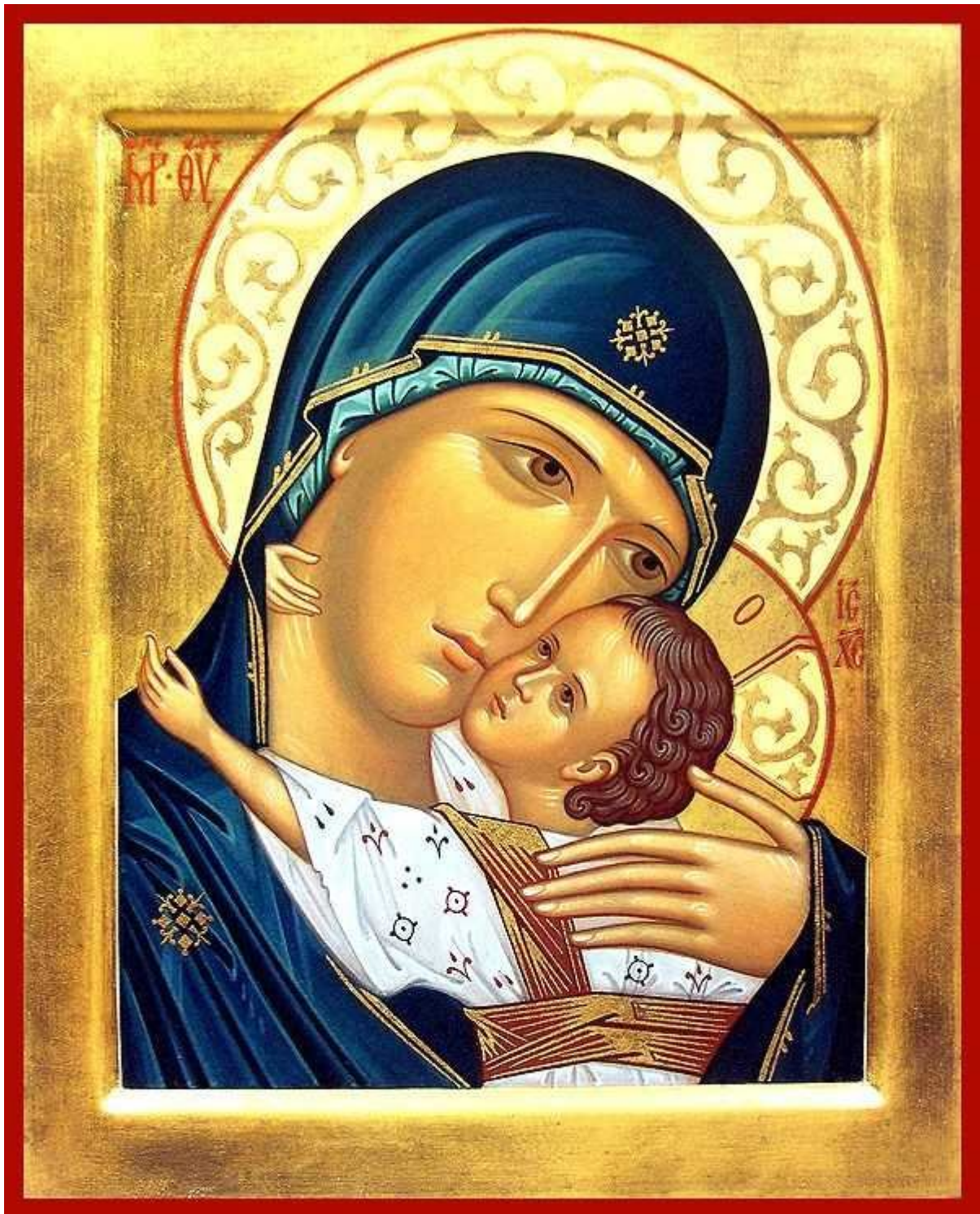
Псково-Печерская икона Божией Матери "Умиление"

Так вот, серьезно сказал священник, - и там и тут простое стекло, но второе стекло немного припудрено серебром.