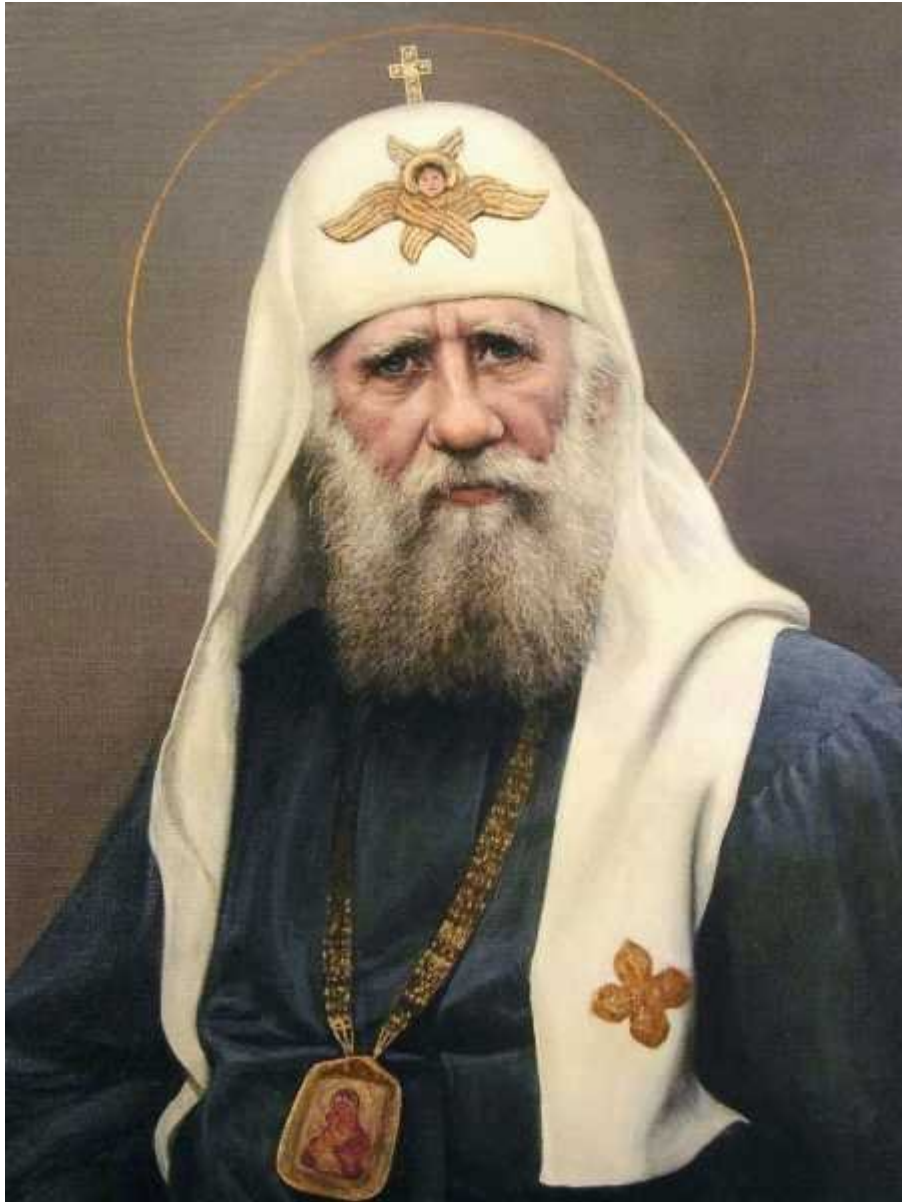
Святитель Тихон, патриарх Московский и всея Руси