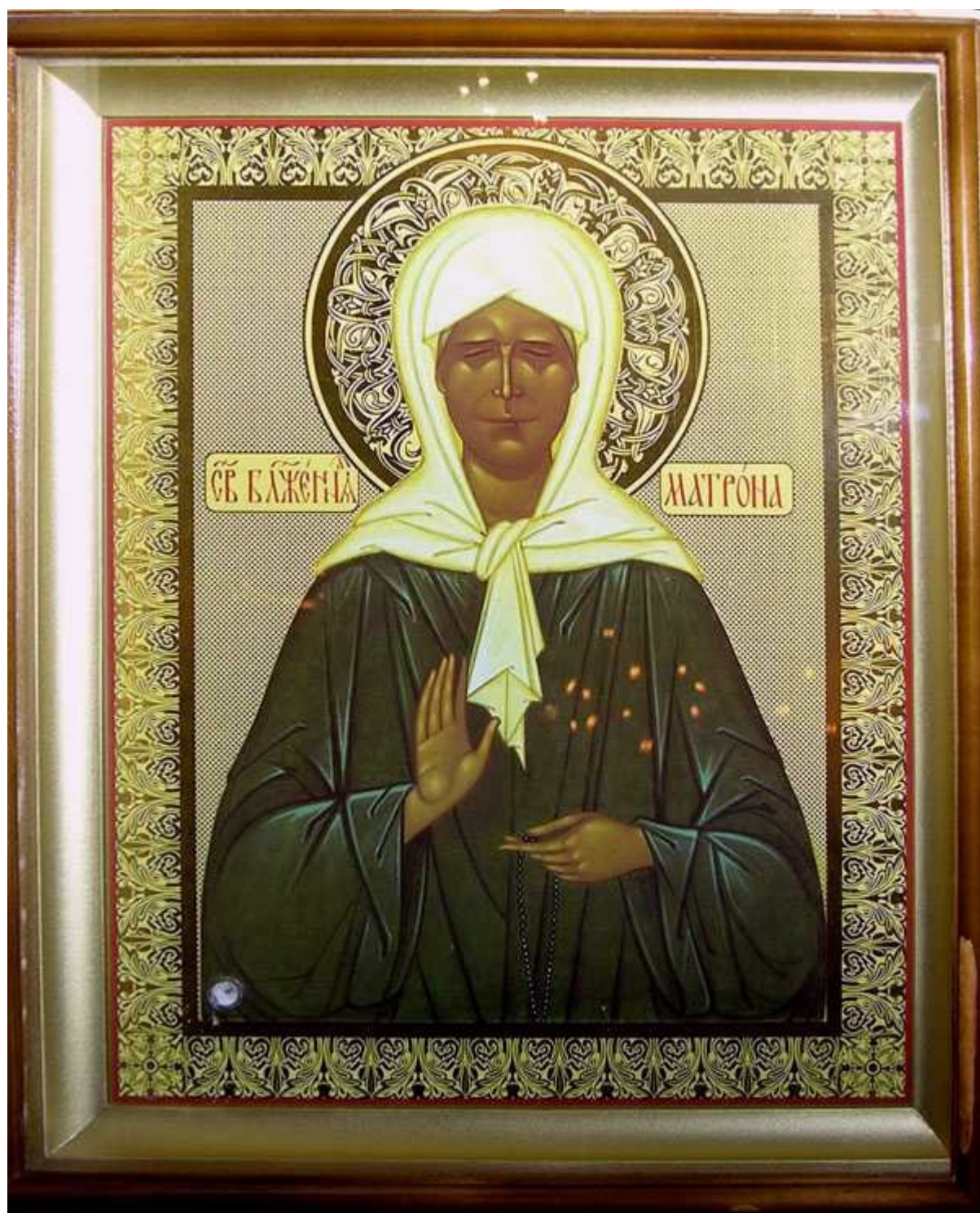
Святая блаженная Матрона Московская, моли Бога о нас!