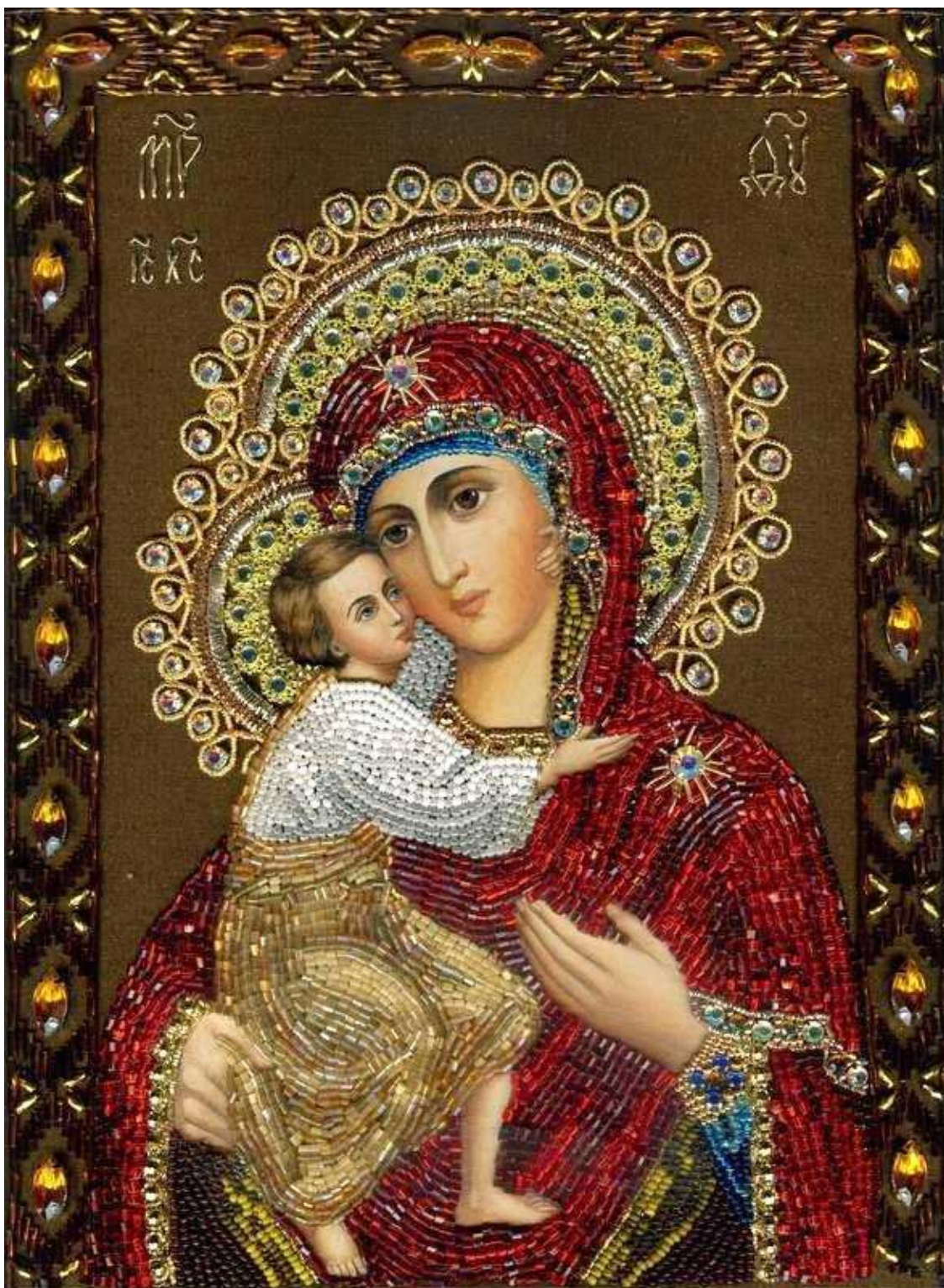
Феодоровская икона Божией Матерью