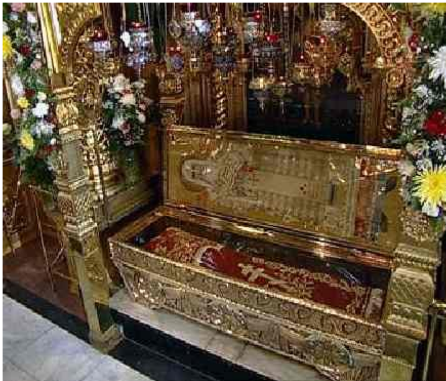
В настоящее время мощи святителя Алексия, митрополита Московского находятся в Богоявленском соборе на клиросе с юга от Царских врат главного престола