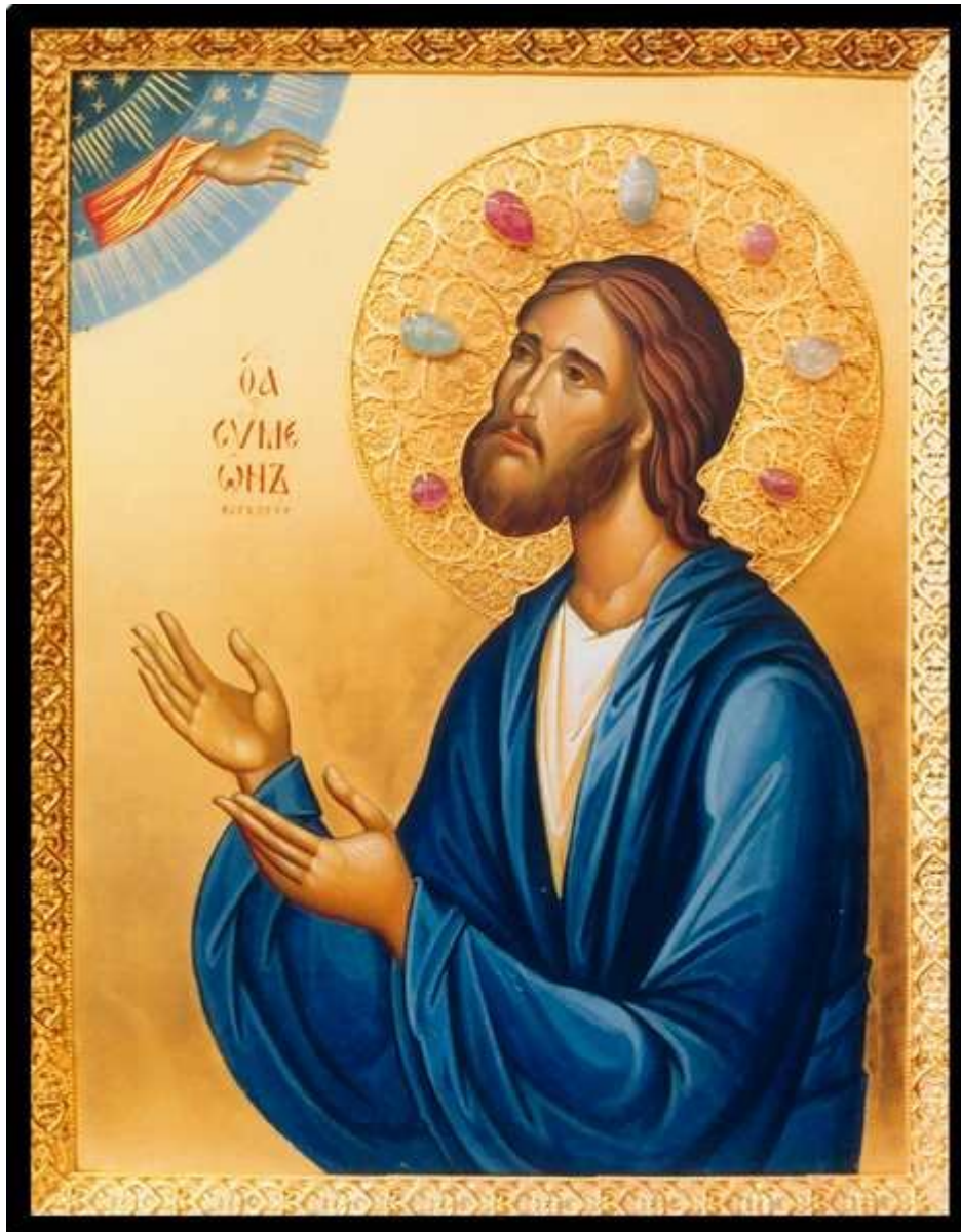
Святой и праведный Симеон Верхотурский