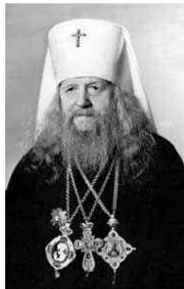
Митрополит Алматинский и Казахстанский Иосиф (Чернов И.М)

Иосиф сегодня дает пример и поучение, и благословение небесное всем государственным деятелям, которые пекутся о хлебе насущном в государстве своем. Аминь.