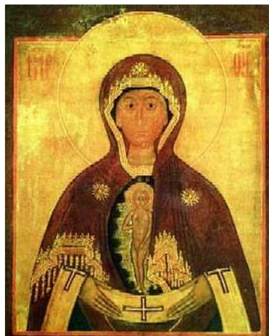
Икона Божией Матери "Слово плоть бысть"

Албазин обстраивался. В двух храмах города - Вознесения Господня и Святителя Николая Чудотворца - возносили Бескровную Жертву албазинские священники. Невдалеке от города (вверх по Амуру) был основан еще один монастырь - Спасский. Плодородная земля кормила хлебом всю Восточную Сибирь. Местное население приобщалось к русской православной культуре, мирно входило в состав многонационального Русского государства, находило у