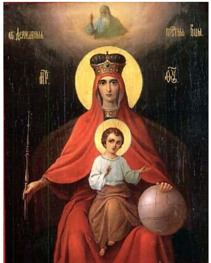
Икона Божией Матери "Державная"

Прп. Пиамы девы (337). Свв. Зинона и Зоила.