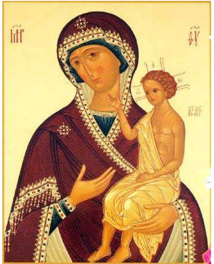
Икона Божией Матери "Воспитание"

Обретение мощей блгвв. кнн. Феодора Смоленского и чад его Давида и Константина, Ярославских чудотворцев (1463). Прмч. Адриана Пошехонского, Ярославского (1550). Мч. Онисия (1). Мч. Канона градаря (огородника). Мц. Ираиды. Мч. Евлогия, иже в Палестине. Мч. Евлампия. Прп. Марка. Прп. Исихия (ок. 790). Иконы Божьей Матери, именуемой "Воспитание". Поминование усопших.